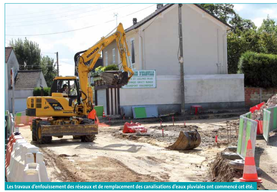
Les travaux d'enfouissement des réseaux et de remplacement des canalisations d'eaux pluviales ont commencé cet été.