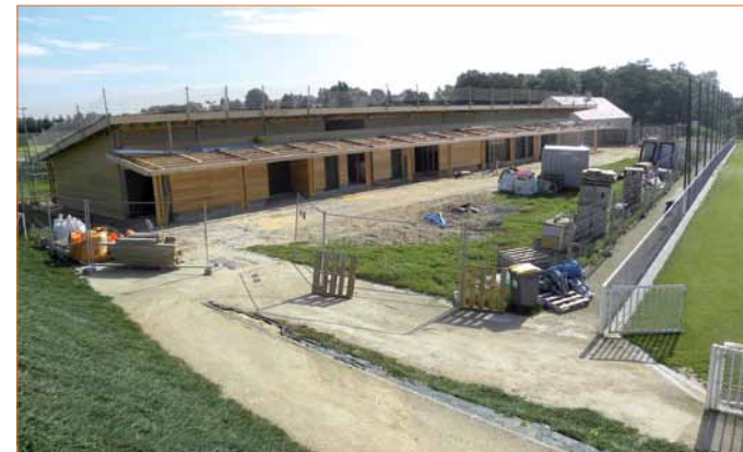
▲ Les vestiaires du stade seront terminés pour la fin de l'année.

La section football, qui compte 395 adhérents avec son école de football à partir de 5 ans jusqu'aux vétérans, est heureuse de vous accueillir sur les nouvelles installations du Stade du Pré Carré comprenant 1 terrain synthétique et 2 terrains en pelouse naturelle. L'encadrement de l'école de football est confié à un éducateur diplômé d'État et de nombreux éducateurs.