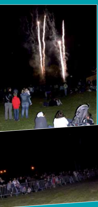
▲ Feu d'artifice du 13 juillet

Pour retrouver le cachet d'une place à l'ancienne, ce nouvel espace public de 2 000 m² sera pavé et éclairé. Il répond également aux