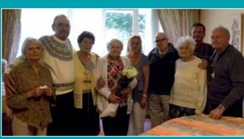
▲ Anniversaires de la RPA le 26 juillet