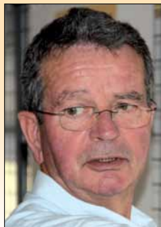
Ezanvillois, Ezanvilloises, Chers amis,

Comme je vous l'avais indiqué dans mon éditto du mois de juillet, j'ai chargé le Directeur Général des Services de la Ville d'Ezanville d'enquêter sur les conditions dans lesquelles les indemnités des adjoints étaient montrées du doigt et la Trésorerie mise en cause par la Chambre régionale des Comptes.