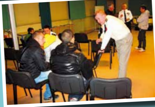
▲ Soirée d'information sur les métiers de l'armée au local Jeunesse