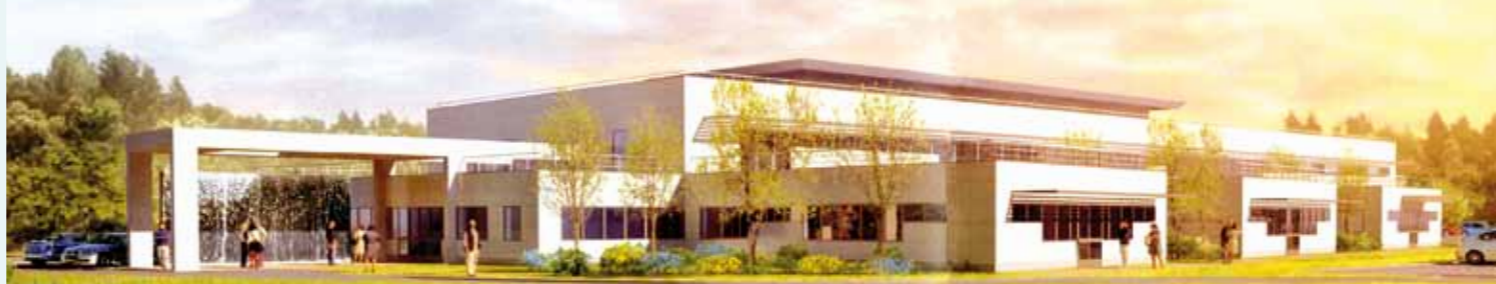
La clinique : la forme du bâtiment a été dictée par la morphologie du terrain en longueur.

1 ER ÉTAGE Bloc opératoire de 8 salles, 14 boxes, 3 salons et locaux annexes