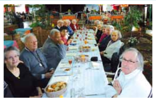
◀ Repas de Noël de la RPA aux Jardins de Maffliers