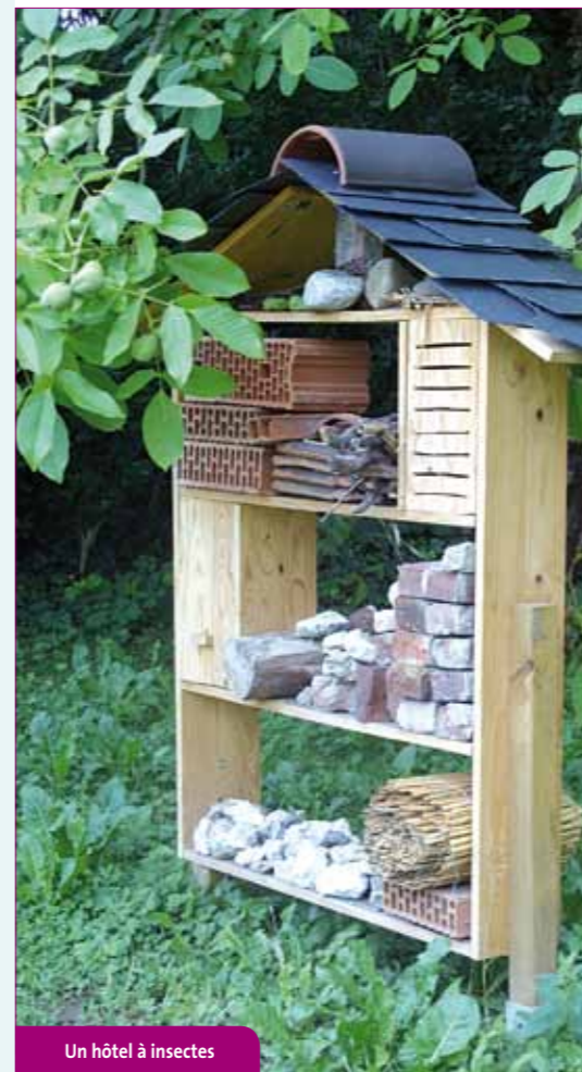
Un hôtel à insectes

Comme vous le savez, la commune s'est lancée dans l'élaboration d'un atlas de la biodiversité ezanvilloise en partenariat avec l'association Inven'terre. Chaque mois, vous retrouverez un article de l'association autour de thèmes différents.