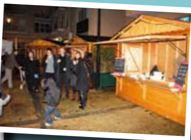
▲ Animations de Noël par l'ADECE