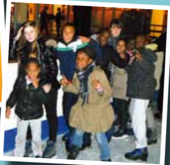
▲ Sortie à la patinoire pour le Service Jeunesse et Familles