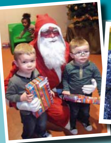
▲ Arbre de Noël de la Crèche