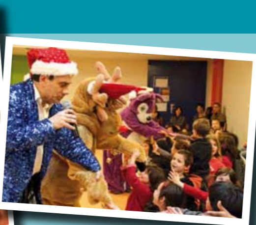
▲ Spectacle de Noël à la Maison de l'Enfance