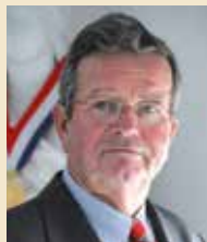
ALAIN BOURGEOIS MAIRE D'EZANVILLE

Chers Ezanvillois, je vous assure que de toute façon, je continuerai à assumer ma fonction tant que je n'aurai pas pu la transmettre. Quelle que soit l'opinion de certains.